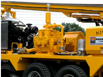
Pompa fango Mud pump Pompe à boue Spülpumpe Bomba de lodo Грязевой насос