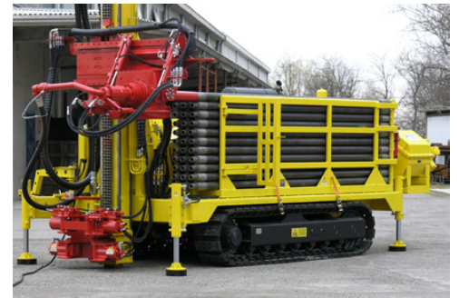
Caricatore aste Pipe loader Chargeur de tiges Bohrgestänge-lader Cargador de barras Автопогрузчик штанг