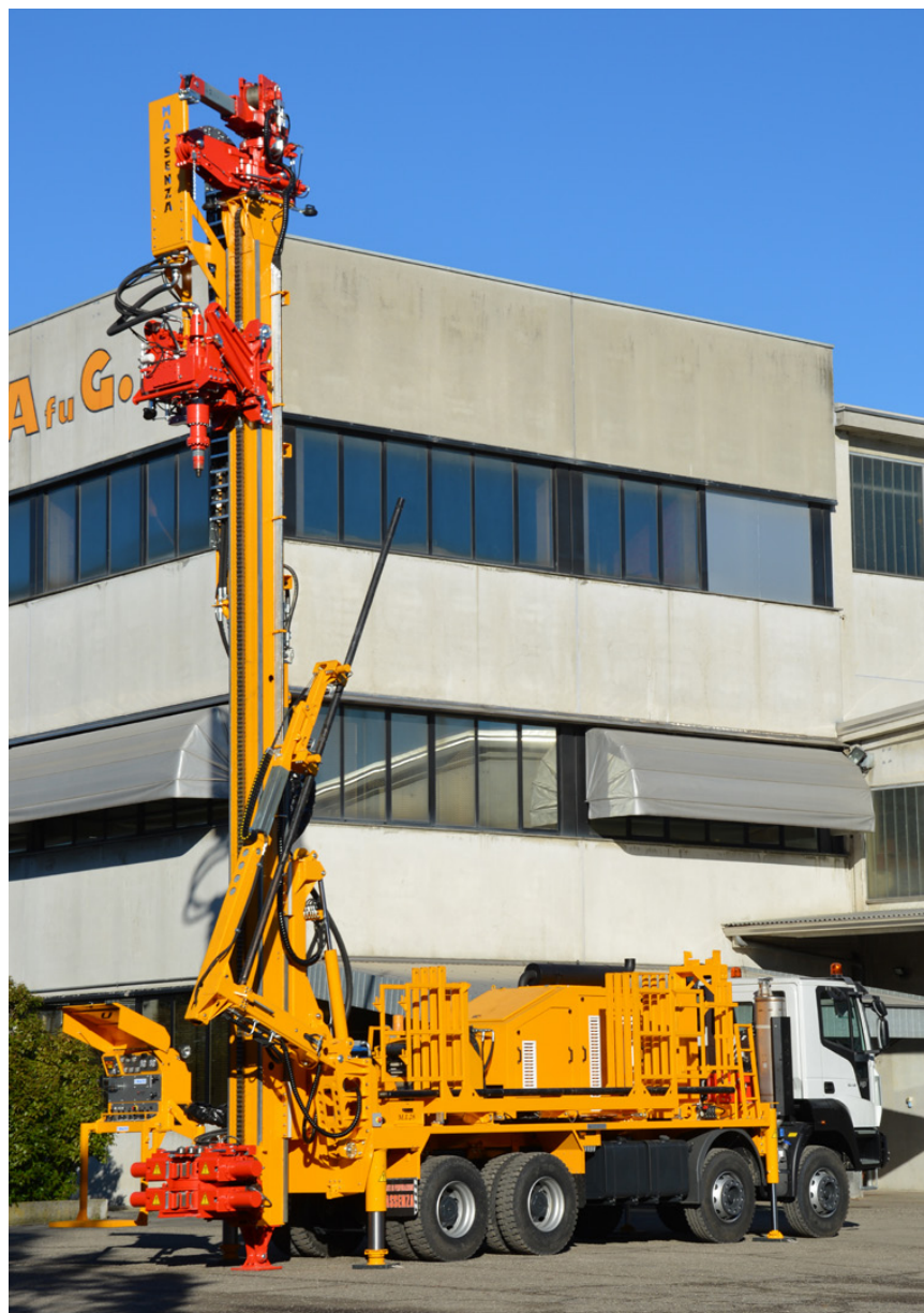
Caricatore aste con braccio Pipe loader with arm Chargeur de tiges avec bras Bohrgestänge-lader mit arm Cargador de barras con brazo Манипулятор подачи штанг