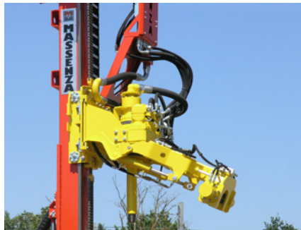
Braccio carica aste Rods loading arm Bras de chargement de tiges Brazo de carga barras Bohrrohr handling system Автоподатчик штанг