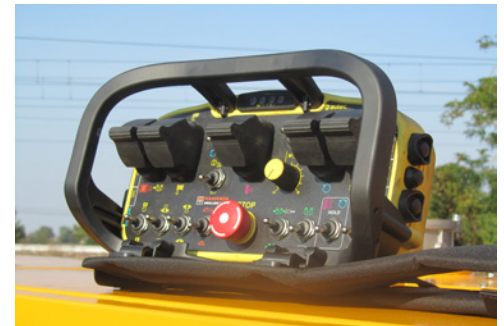
Radiocomando Radio remote control Télécommande Mando a distancia Fernbedienung Пульт радиоуправления