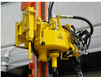
Testa di rotazione con martello a percussione Rotary head with hydraulic hammer Tête de rotation avec marteaux hydraulique Drehkopf bei hydraulii hhammer Cabeza de rotación con Martillo Hidráulico Головка вращения с ударным молотом