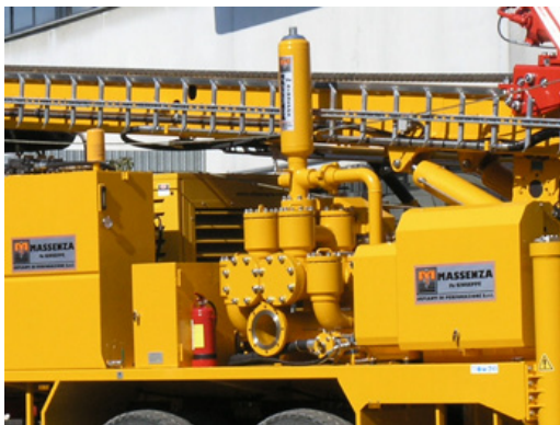
Pompa fango Mud pump Pompe à boue Spülpumpe Bomba de lodo Грязевой насос