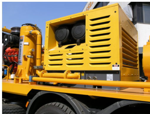
Compressore d'aria Air compressor Compresseur d'aire Kompressor Compresor Компрессор