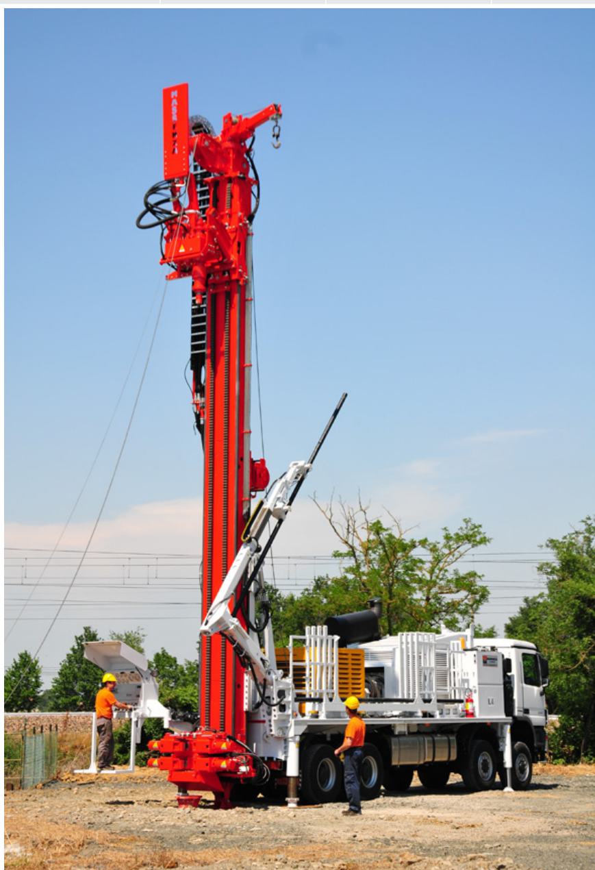
Caricatore aste con braccio Pipe loader with arm Chargeur de tiges avec bras Bohrgestänge-lader mit arm Cargador de barras con brazo Манипулятор подачи штанг