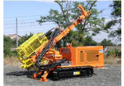
Massima stabilità in ogni posizione e gabbia di sicurezza (optional) Maximum stability in all directions and safety cage (optional) Stabilité maximum dans toutes les positions et cage de protection (en option) Maximale Stabilität in jeder Position und Sicherheitskäfig (optional) Máxima estabilidad en todas las direcciones y jaula de seguridad (opcional) Максимальная устойчивость в любом положении и защитное ограждение (опция)