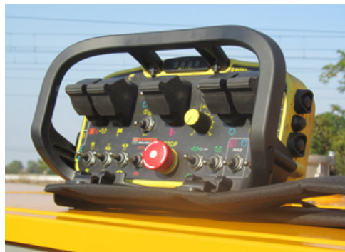
Radiocomando Radio remote control Télécommande Mando a distancia Fernbedienung Пульт радиоуправления